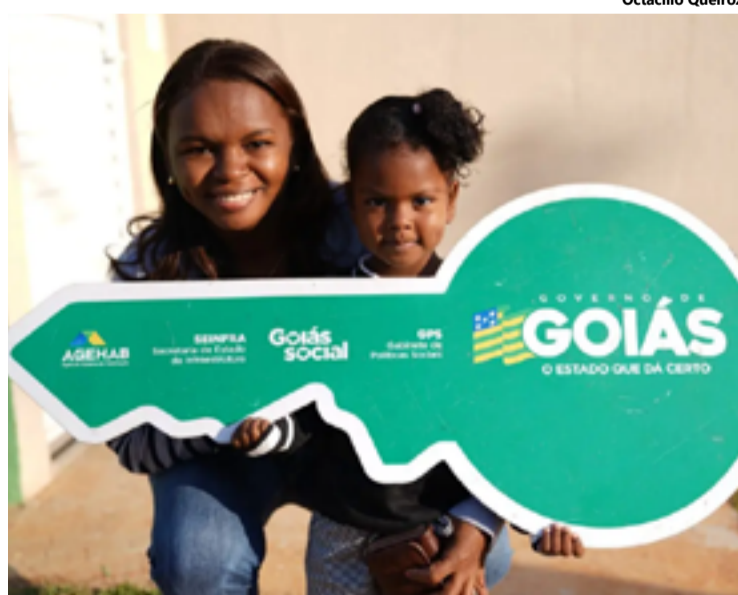
O credenciamento dos municípios é feito de forma 100% on-line, por meio da Plataforma Conecta Prefeitos

A realização de chamamento público aos municípios garante um fluxo mais célere