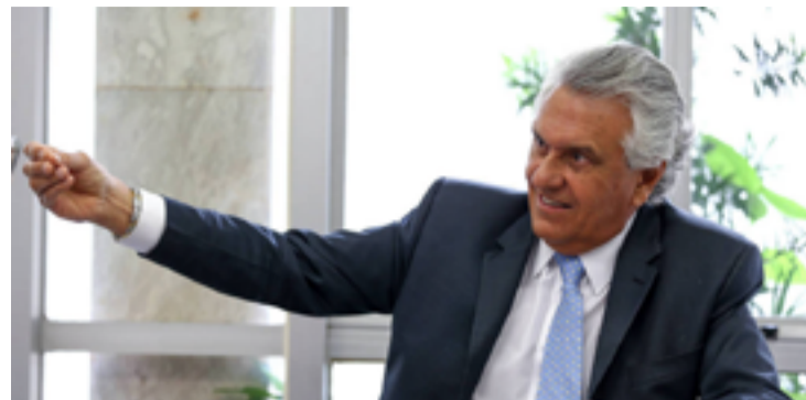
Ronaldo Caiado: debate é para discutir propostas