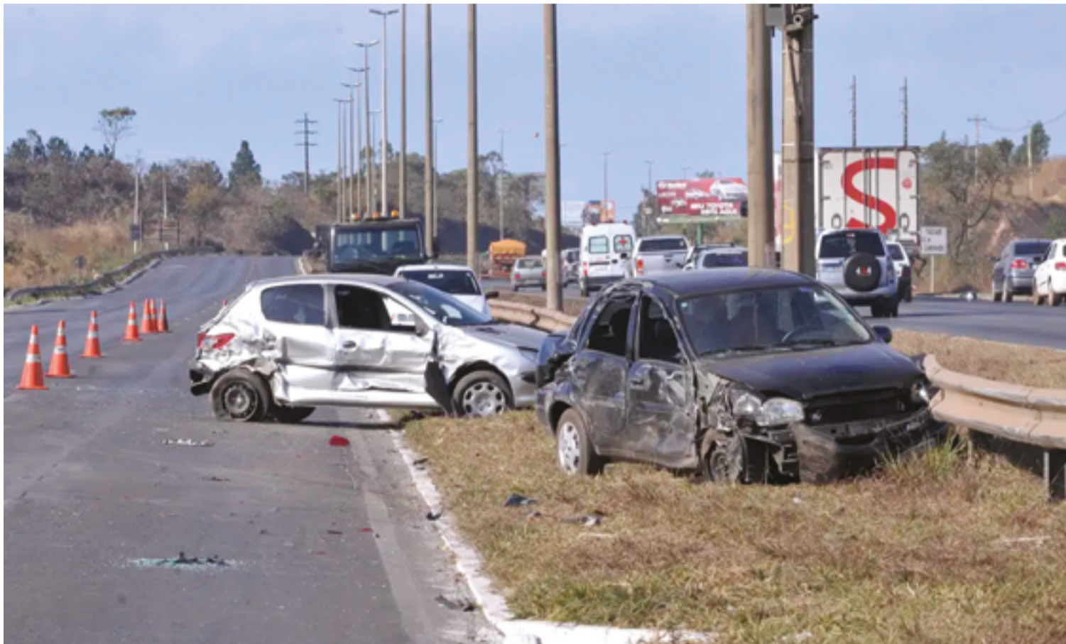
Número considerável de mortes de pessoas no trânsito ocorre nos hospitais e, devido a essa condição, erroneamente deixam de constar das estatísticas

De acordo com os dados oficiais do Renatran, está estabelecida a gravidade dos registros de acidentes e de óbitos