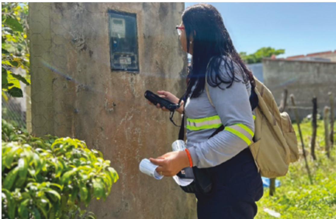
Fatores como portões fechados, cães bravos e visores sujos prejudicam trabalho dos leituristas durante visitas