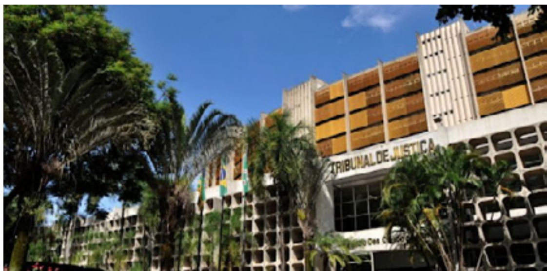
O julgamento foi marcado pela apresentação de detalhes que reforçaram a premeditação do crime.

O caso foi classificado como homicídio qualificado, dado que os jurados consideraram que Kamrul agiu com uso de meio cruel e sem possibilitar a defesa da vítima. Segundo as investigações, o réu abordou a vítima de surpresa, a ameaçou, amarrrou suas mãos e pés, e utilizou uma fita plástica para amordaçá-la, o que levou à morte de Mahfuzur por asfixia. Esse método cruel de execução foi destacado durante o julgamento, reforçando a gravidade das acusações e resul-