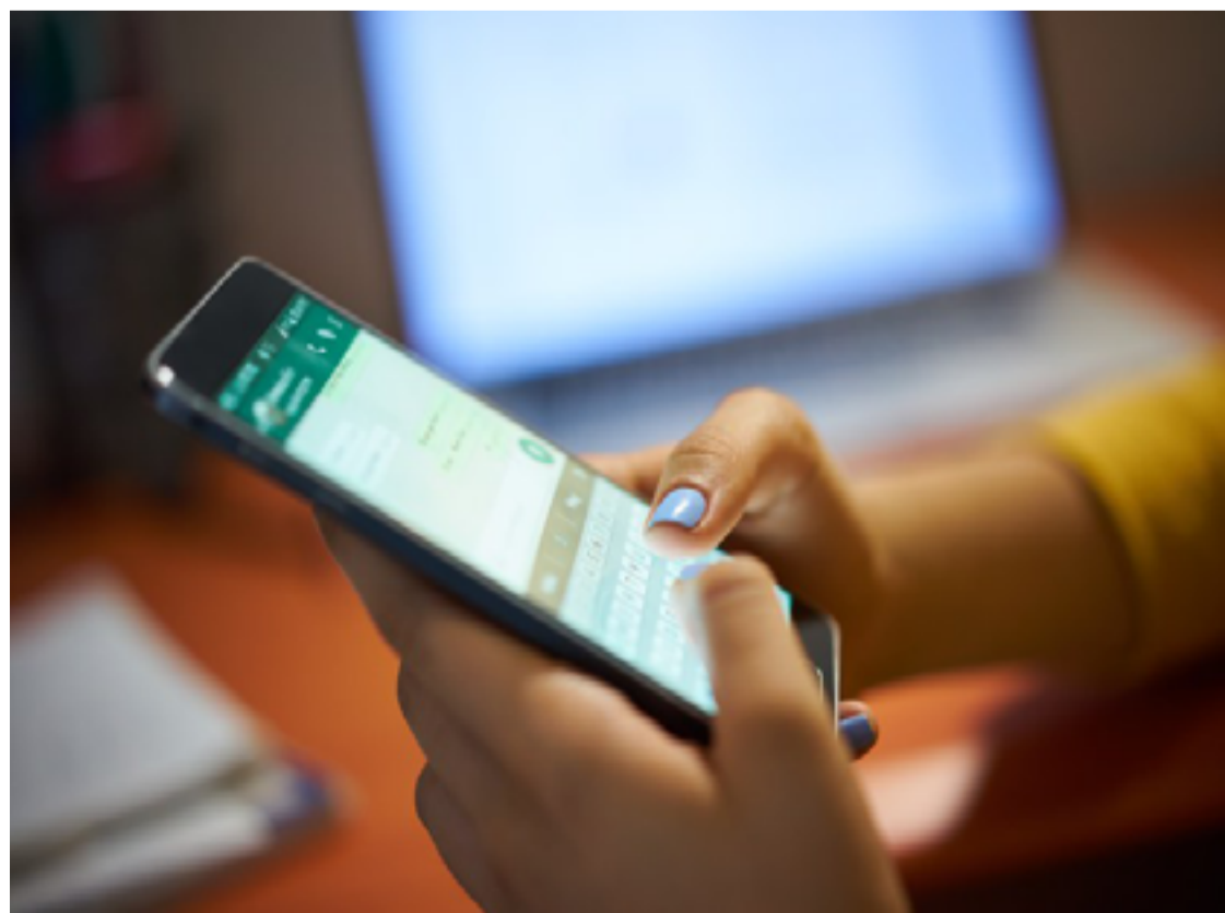
A Ouvidoria da Mulher e da Diversidade (OMD) é um canal especializado para o recebimento de demandas referentes à violência contra mulher e à diversidade

O contato com a Ouvidoria da Mulher e da Diversidade poderá ser realizado: I – presencialmente, na sala da Ou-