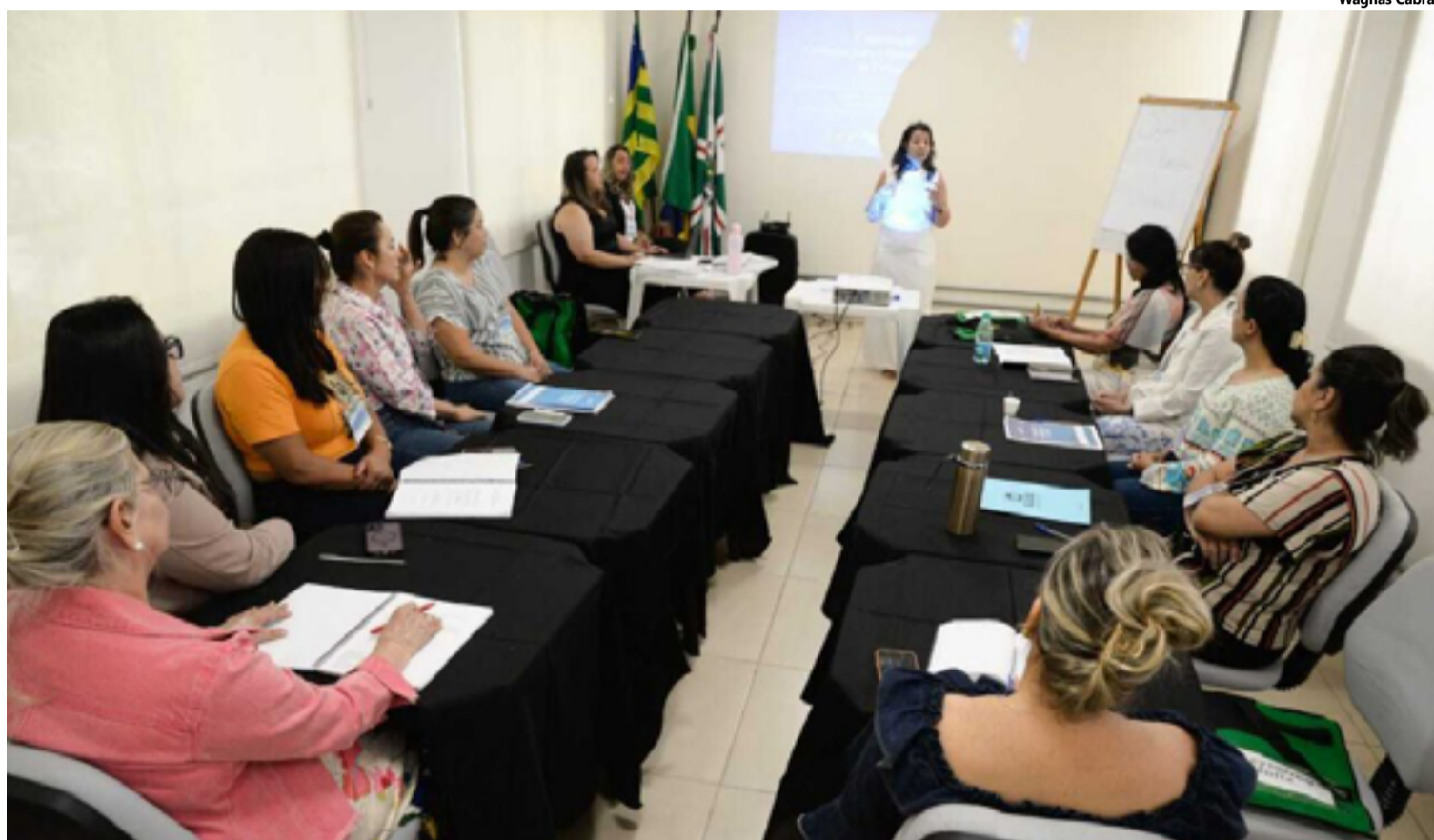
Formação capacita supervisores que atuarão com as famílias em todos os municípios que participaram do programa

polis, Campos Belos de Goiás, Goianópolis, Goiânia, Rio Verde, Trindade, Turvelândia, Vila Boa, São Miguel do Araguaia e Goiatuba também passaram pela formação durante toda a semana.