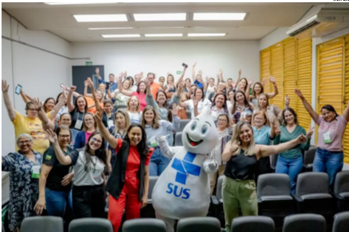
O primeiro módulo da Oficina Seriada para Multiplicadores em Imunização reuniu 40 servidores das 18 Regionais de Saúde

O primeiro módulo começou nos dias 11 e 12 de setembro e termina dias 25 e 26 de setembro, na Faculdade de Enfermagem e Nutrição da UFG. O módulo II será realizado nos dias 1 e 2 de outubro, no mesmo